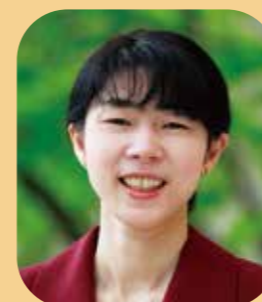
講師 音楽 I a(理論、声楽)