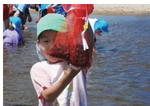
図7：採集したシジミを見せたり、音を出したりして遊ぶ