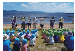
図4：地元中学校美術部が作った「スモウアシコシ」紙芝居