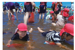
図8：シジミ採りを十分楽しんだ後、宍道湖と遊ぶ