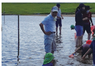
図5：リスク管理のためのロープ設置と見守り