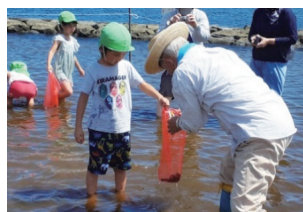
図6：ボランティアスタッフと触れ合う様子