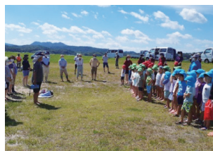
図2：始まりのあいさつ・ボランティアスタッフの紹介