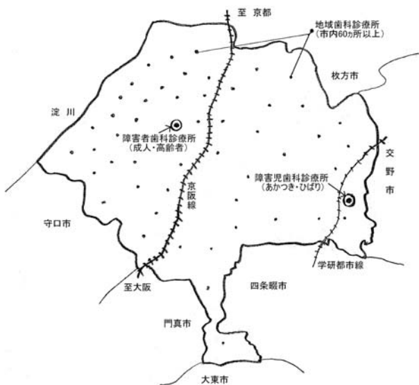
図1 寝屋川市障害者地域歯科診療所配置イメージマップ

この診療所の開設により、寝屋川市の障害者の全ライフステージにわたる地域歯科医療システムの完成形ができあがった。それから10年、これら二つの障害専門歯科診療所と地域歯科診療所がどのような構造と機能をもってシステム化されているか説明する。（図1、図2参照）